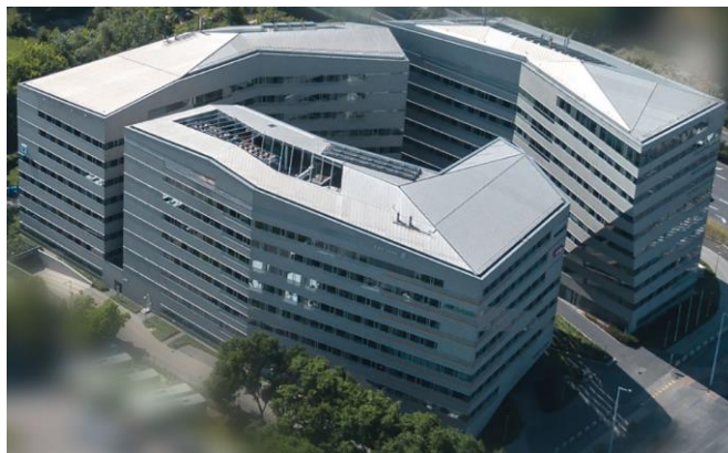
A Népliget Center Irodaház madártávlatból

Üzemeltető: White Star Real Estate Kft. (1124 Budapest, Csörsz utca 49-51.)